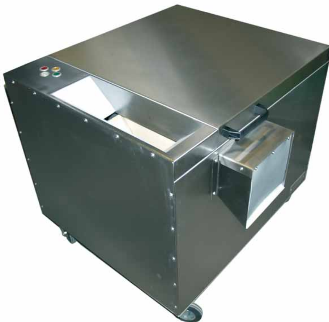
TROWAL BESTECKTROCKNER/-polierer BT 50